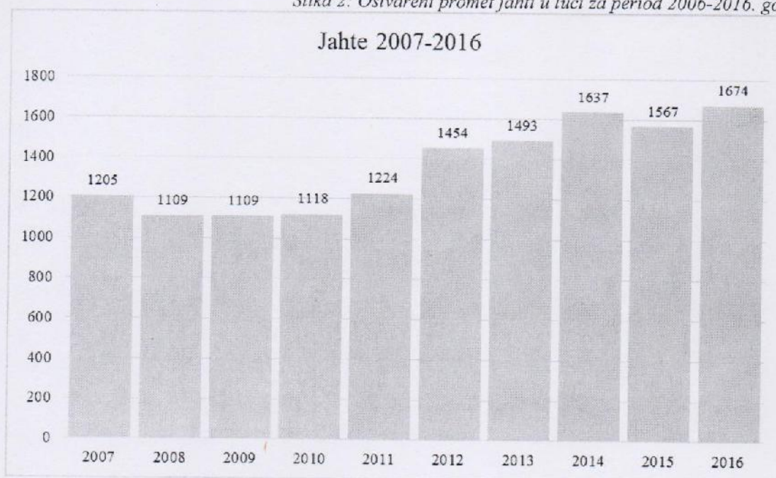
Slika 2: Ostvareni promet jahti u luci za period 2006-2016. god.

Kroz posmatrani period konstatuje se prosječna stopa rasta dolazaka jahti od 3% na